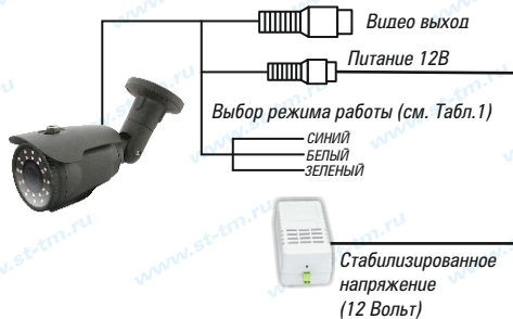
Рис.1 Схема подключения