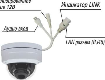
Рис.1 Схема подключения