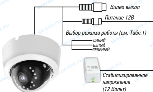
Рис.1 Схема подключения