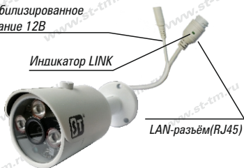
Рис. 1 Схема подключения видекамеры