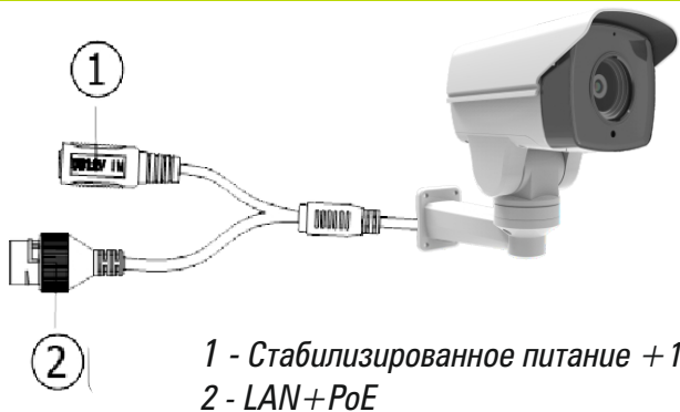
1 - Стабилизированное питание +12В 2 - LAN+PoE