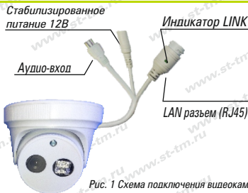
Рис. 1 Схема подключения видеокамеры