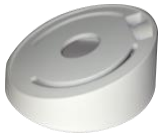
DS-1259ZJ Потолочное крепление