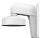
DS-1273ZJ-130-TRL Настенный кронштейн